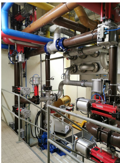
Nouvelles vannes pneumatiques et les conduites

Les travaux (adaptation de la tuyauterie du digesteur no 1 pour le fonctionnement avec digesteur no 2, remplacement du système de brassage, modification du chauffage, remplacement et automatisation des vannes, changement des deux pompes de circulation des boues, pose d'un nouveau tableau électrique) ont été terminés au début du mois de décembre.